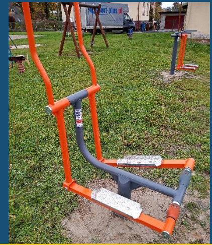
Grodziec, gm. Niemodlin