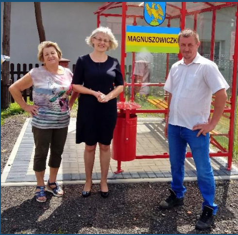
Magnuszowiczki, gm. Niemodlin