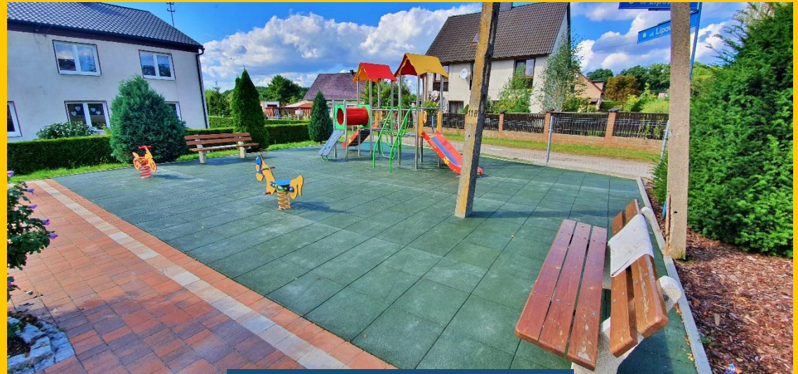
Osowiec, gm. Turawa