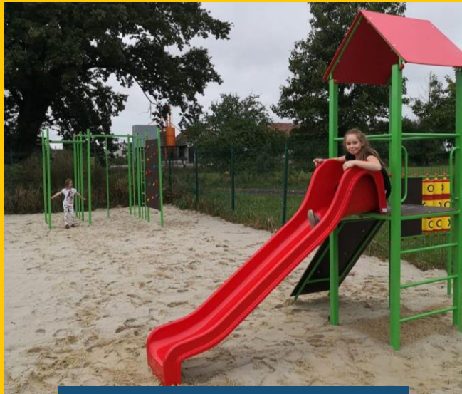
Rybna, gm. Popielów