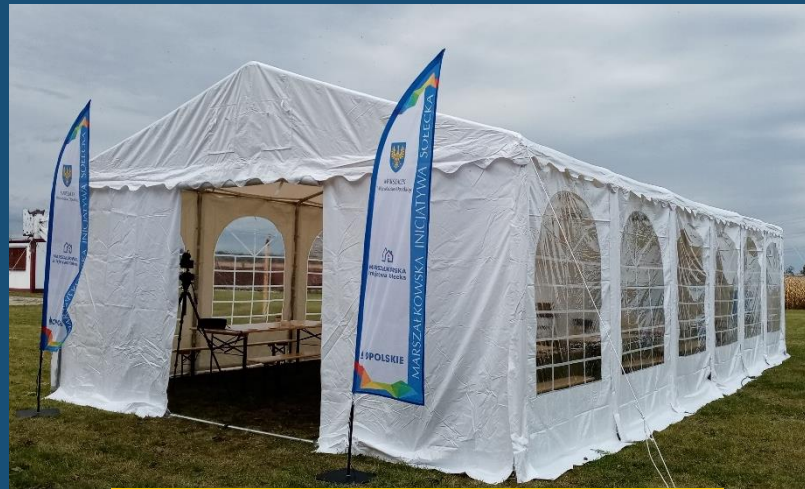
Sarny Wielkie, gm. Niemodlin