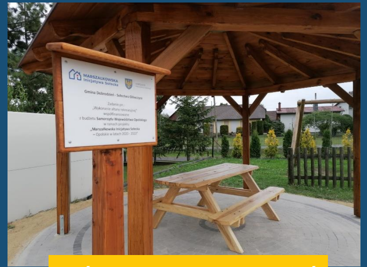
Główczyce, gm. Dobrodzień