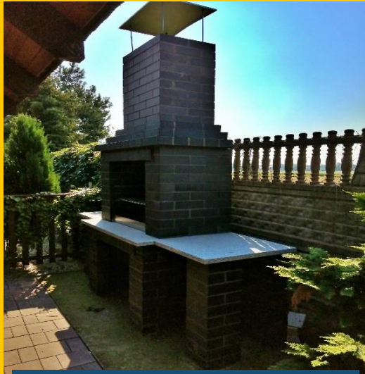
Kotórz Mały, gm. Turawa