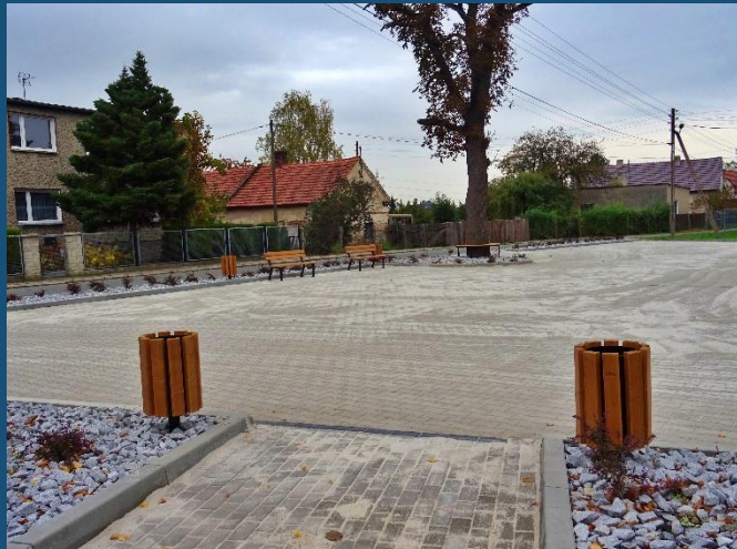
Komprachcice, gm. Komprachcice