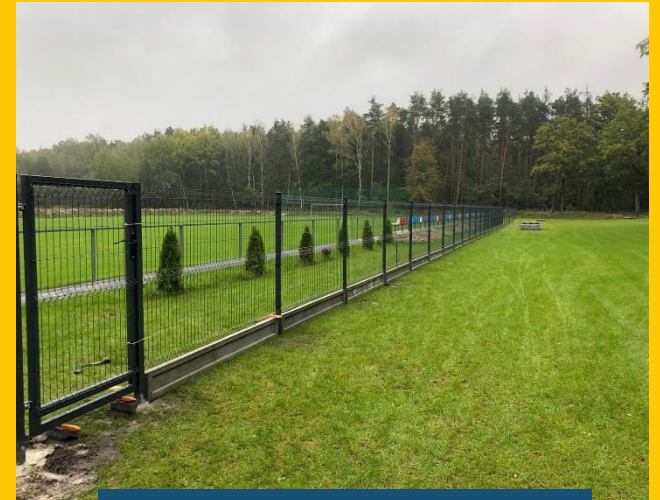
Raszowa, gm. Tarnów Op.