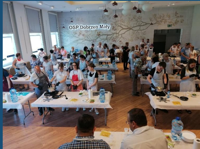
Dobrzeń Mały, gm. Dobrzeń Wielki