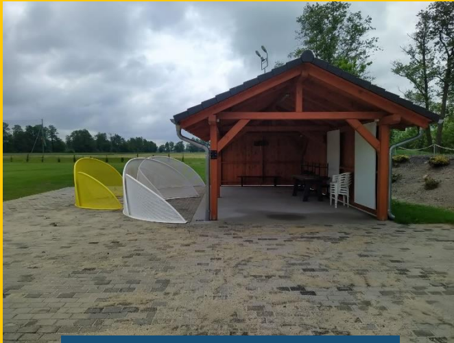
Dębie, gm. Chrzęstowice