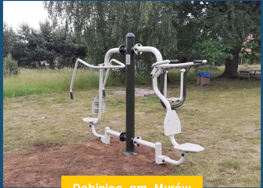
Dębiniec, gm. Murów