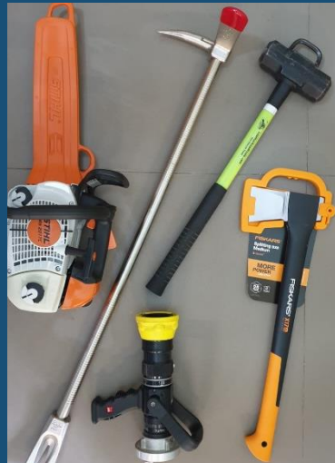
Stare Budkowice, gm. Murów