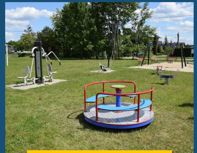
Antoniów, gm. Ozimek