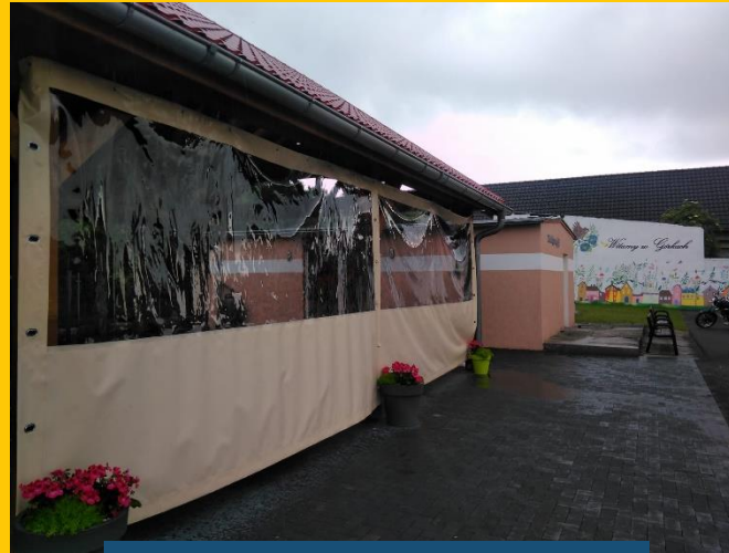
Górki, gm. Prószków