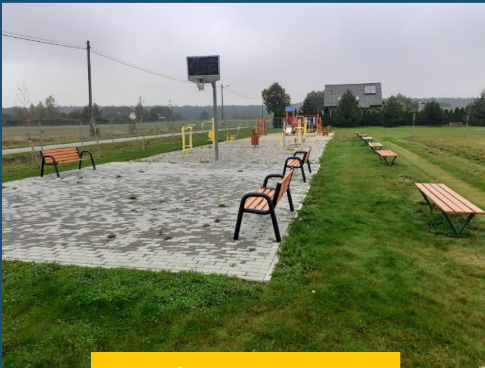
Karczów, gm. Dąbrowa