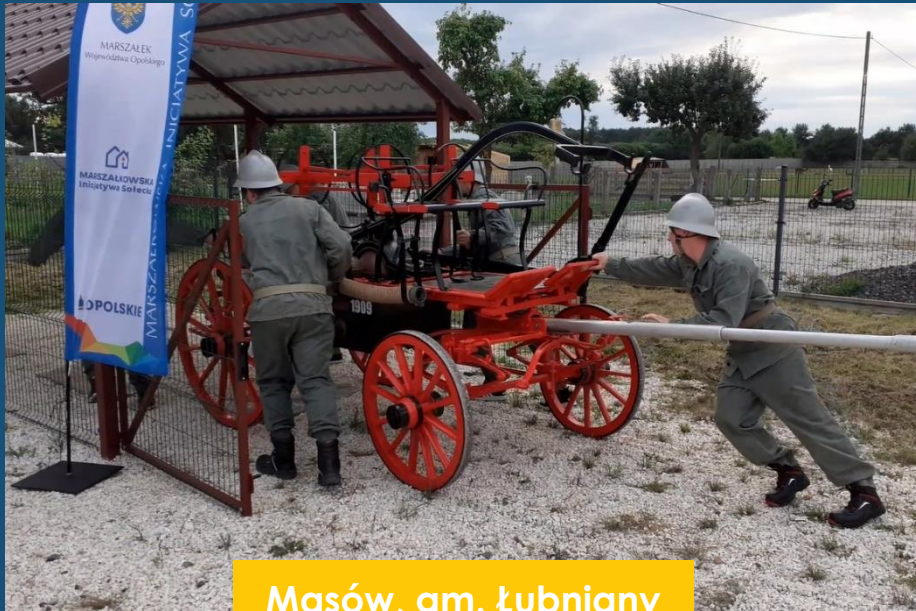
Masów, gm. Łubniany