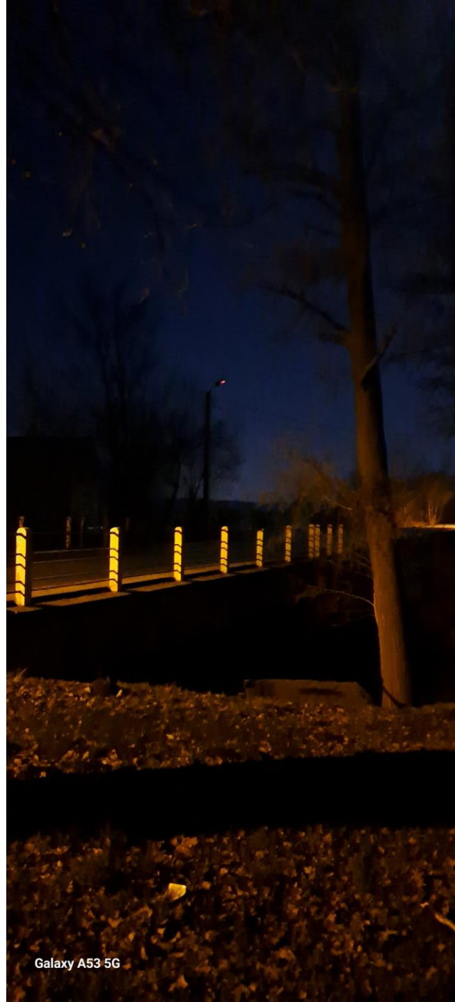
Galaxy A53 5G